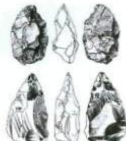
Орудия труда первобытного человека обнаруженные в пещере Азых.