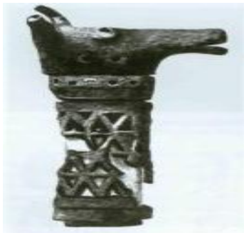
Бронзовая голова быка. IX век до н.э.

Не имеющий аналогов огромный могильник, состоящий из более чем ста погребальных курганов разных размеров и форм, был обнаружен и исследован недалеко от Шуши. Там же находилось большое количество каменных ящиков. Могильное поле функционировало в течение очень длительного времени, с последних веков II тысячелетия до н.э. до VIII-VII вв.