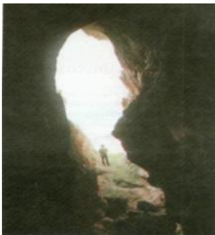
Вход в пещеру Азых.