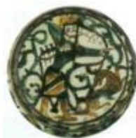
Блюдо с полихромной росписью. XII-XIII века. Бейляган.