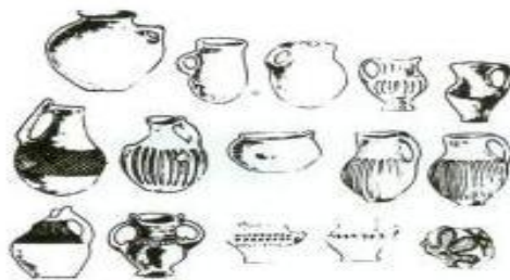
Чернолощенный сосуд. XIII-XI века до. н.э.

материала. Долина реки Куручай закрыта от ветров горами и славится плодородием почвы. Она ступенчатыми террасами спускается по направлению к Мильской степи и там окончательно с ней сливается. Здесь природа создала идеальные условия для развития флоры и фауны и обоснования первого человека. Тем более что район был богат сырьем для производства каменных орудий труда.