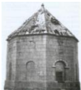
Мавзолей Панах хана.

В Шуше и ее окрестностях сохранилось большое количество оборонительных сооружений. Эти величественные каменные памятники истории представляют огромную ценность для исследователей. Глядя на них, понимаешь, какой ценой нашим предкам удавалось сохранить свою независимость. Еще большую информацию об истории и материальной культуре города несут сохранившиеся до наших дней мемориальные сооружения: дворцы, караван-сарай, бани и жилые дома Шуши.