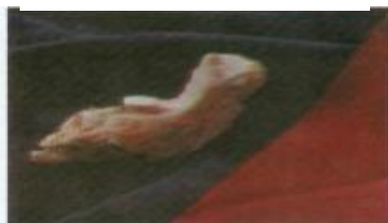
Фрагмент нижней челюсти азыхантропа.