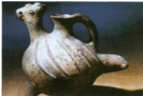
Сероглиняный ритон. Физули (село Молла Магеррамлы). VII-V века до н.э.

до н.э. Наиболее поздними являются курганы с каменными насыпями над большими погребальными каменными ящиками. В них обнаружен наиболее интересный погребальный инвентарь. Здесь были найдены ассирийская поливная керамика и бусина с клинописью, которая содержит имя царя Ададнерари. Кроме того, была найдена поливная шкатулка ассирийского царя. По этим предметам была произведена датировка поздней группы погребений.