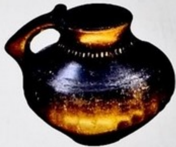
Слева – вид из Азыхской пещеры на долину. Вверху – керамический сосуд типа бумана XIII–VIII веков до н.э.

Трудно переоценить это открытие ученых. Оно – прямое свидетельство революции в развитии человеческого мышления. Охотник, нанесший острым камнем эти бороздки, был столь же велик, как и создатель кибернетики Норберт Винер, как Архимед и Лобачевский. Придумав элементы счета, человек из Азыхской пещеры не только стал предтечей появления такой науки, как математика, но, что еще важнее, впервые попробовал зафиксировать мысли, сохранить знания.