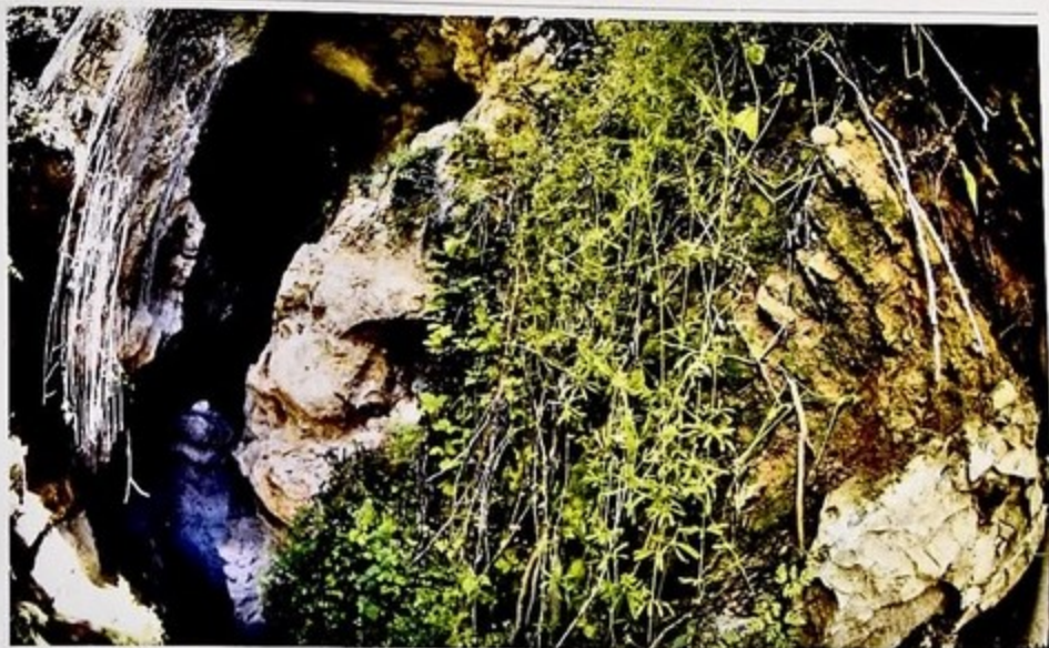
Вход в Азыхскую пещеру – одно из самых древних в мире жилищ человека. Dəyüçü zən qədim insan məskənlərindən biri olan Azix mağarasına giriş.

Əsrlər, minilliklər bir-birini əvəzləyirdi... Minlərlə kilometr məsafəni dayanmadan qat etməli olan dəmiryol lokomotivini xatırladan tarix yavaş-yavaş "sürətini artırır". Qarabağda yaşayan insanlar ev tikməyi, mal-qaranı otarmağı, torpağı becərməyi öyrənmişdilər. İlk sənət növləri – duşçuluq, ayırma sənəti, toxuculuq meydana gəldi. Rifah yüksəldikcə cəmiyyətin varlı və kasıblara, rəhbər və sadə əkinçilərə bölünməsi başladı. Patriarxat qatı surətdə bərqərar oldu. İctimai təşkil etmə, qəbilədaxili