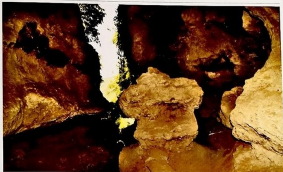
Верху – внутренняя часть Азыхской пещеры. Справа – бронзовое украшение из Карабаха. Хранится в Музее археологии и этнографии ИАН Азербайджана.

1960-cı ildə bu mağaranı aşkar edən ovçular bu qeyri-adi tapıntı barədə arxeoloqlara xəbər verdilər. Mağaranı tədqiq edən mütəxəssislər bunun haqiqətən də müstəsna əhəmiyyətli kəşf olduğunu inandılar. İlk növbədə mağaranın ölçüləri heyrat doğururdu. O ümumi tunellə bağlı 8 uca zaldan ibarət idi. Hündürlüyü 20 metrə çatan tağtavanlardan aşağıya doğru qalın stalaktit sütunlar uzanırdı. Lakin ən təəccüblüsü isə torpaq döşəmənin ümumi qalınlığı 14 metrə çatan ən azı 10 mədəni təbəqədən ibarət olması idi. Mağarada daş dövrünün bütün mərhələləri təmsil olunmuş, ibtidai insanın meydana gəlməsi və həyat tərzi barədə çox şey aydınlaşdırmaq üçün artefaktlar aşkarlanmışdı. Bu tapıntıların sayı bir neçə minə çatırdı. Onların arasında ilk əmək alətləri, eləcə də 700 min il əvvəl əcdadlarımızın istisna qızdığı ocağın