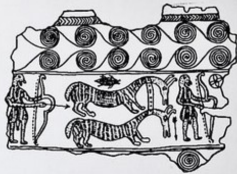
Фрагмент рисунка с бронзового веинского сосуда. Tapılan hazırlanmış dəyüçü kəməri rəsminin fragmenti.

həkk etmiş ovçu kibernetikanın banisi Norbert Vineç, Arximed və Lobaçevski qədər dahidir. Hesabın ünsürlərini tətbiq edən Azix mağarasının sakinini riyaziyyat elminin meydana gəlməsinin müjdəçisi olmaqla yanaşı, daha mühüm təşəbbüsə – öz fikirlərini təsbit etməyə, biliklərini qoruyub saxlamağa ilk dəfə olaraq say göstərmişdir.