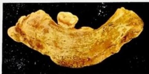
Нюокса чөлвәти алысантропа. Хранится в Иерусалимском музее истории Азербайджана. Верху – петрографы, обнаружен- ные в Кельбаджарском районе.

Azərbaycanın alt çuq sənayəti Milli Azərbaycan Tarihi Muzeyində saxlanılır. Yuxarıya – Kəlbəcər rayonunda aşkar edilmiş petroqraflar.