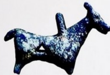
Найденное украшение. Səndəl.

Во второй половине IV тысячелетия до н.э. наступила эпоха бронзы, а с нею возникла и уникальная Кура-Аразская культура, связавшая воедино на долгое время обитателей Центральной и Восточной части Южного Кавказа, Северо-Восточного Кавказа, Южного Азербайджана и Восточной Анатолии.