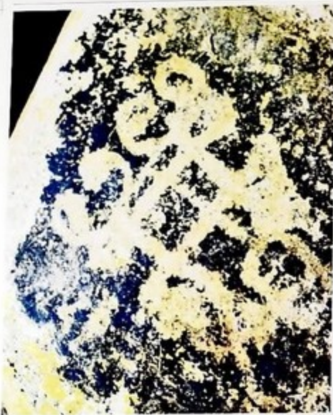
«Оксиды архаичных доминант челюсти питекантропа» это Карабах был заселен миссионером наезд.

Археологларın köhnə insanın Qarabağın mənliklərinə mədəniyyətlərinə dair xəbərlər dövlət aşkar etmiş.