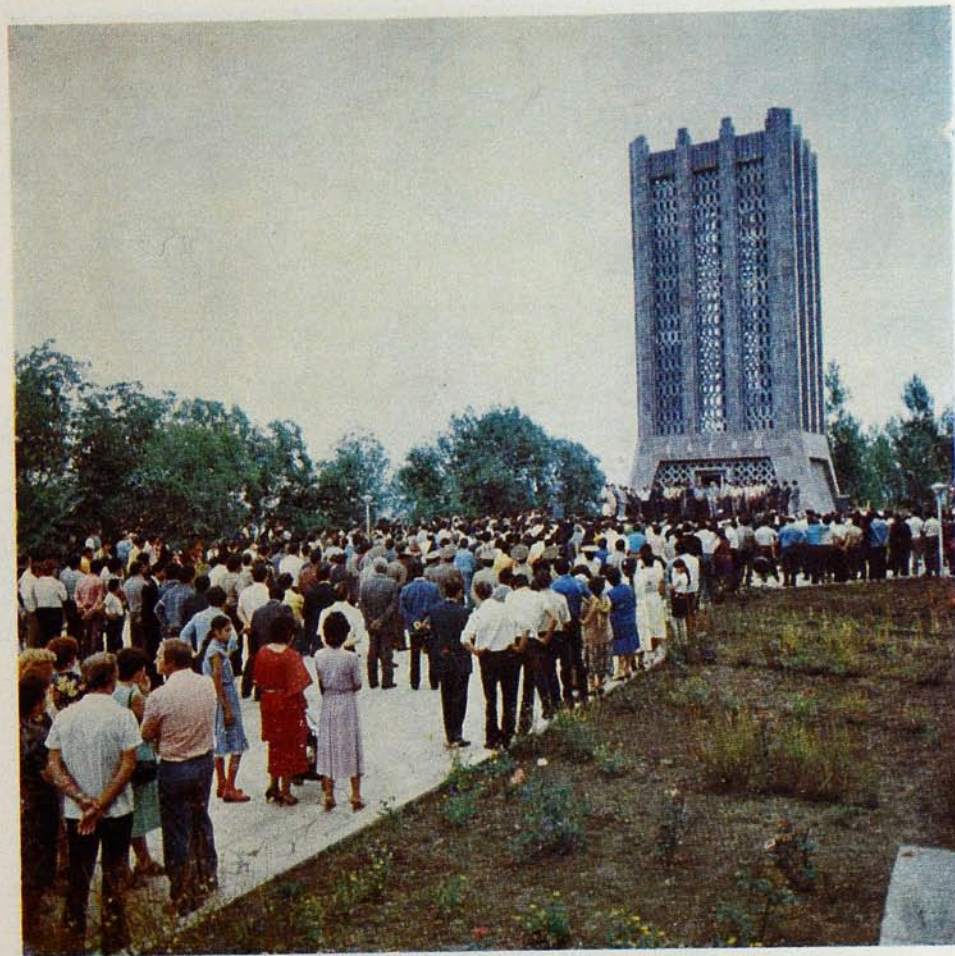
34. Вагиф поезијасы бајрамы.

Народный поэт Самед Вурғун создал бессмертную драму «Вагиф», посвященную жизни и деятельности Молла Панаха Вагифа.