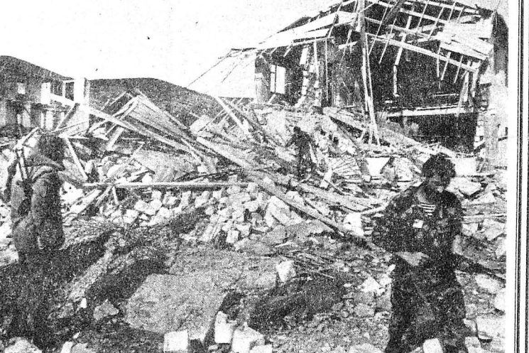
Село Манлики Агдеринского района... Чудом удалось проникнуть сюда с группой бойцов Национальной армии. Армянские бандформирования из соседних сел держат его под постоянным прицелом. Так что снимать пришлось под шквал пулеметных очередей. В объективе камеры — один румын, полностью разрушенное, разграбленное, опустошенное азербайджанское село.

ЛОНДОН, 13 мая. (ИТАР-ТАСС). Осуществляющий полномочия Президента Азербайджана Председатель Верховного Совета республики Ягуб Мамедов заявил, что в это трудное время он не уйдет в отставку и сделает все необходимое в интересах своего народа, включая возврат захваченных армянами азербайджанских территорий. В интервью корреспонденту агентства Рейтер в Баку он подчеркнул, что Азербайджан «несмотря даже на захват города Шуши силой, по-прежнему выступает за мирное решение карабахской проблемы».