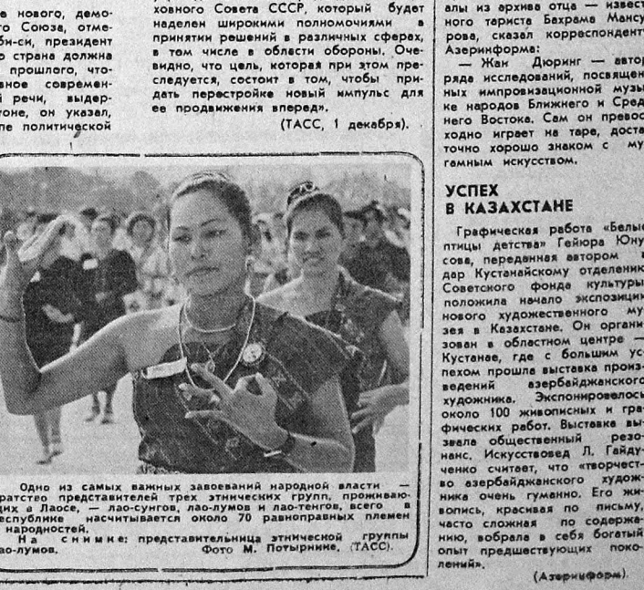
Одно из самых важных завоеваний народной власти — братство представителей трех этнических групп, проживающих в Лосе, — лас-сунов, лас-думов и лас-тенгов, всего в республике насчитывается около 70 равноправных племен и народностей. И в с. н. и. е. представители этнической группы лас-думов.

БОНН Нынешняя сессия Верховного Совета СССР обсуждает ряд важнейших вопросов, имеющих основополагающее значение для продолжения развития политической реформы в Советском Союзе, для успеха всего процесса советской перестройки, сообщает телевидение ФРГ. Сессия, на которой значительное внимание уделяется решению вопросов международных отношений, как ожидается, даст мощный импульс совершенствованию политической жизни в стране. Гармонизация отношений между СССР и входящими в его состав союзными республиками станет, как отмечалось на сессии, следующим крупным этапом политических преобразований в Советском Союзе. ТОКИО «Проект изменений в Конституции СССР, — передает японская телекомпания Эн-эйч-эй, — предусматривает учреждение поста Председателя Верховного Совета СССР, который будет наделен широкими полномочиями в принятии решений в различных сферах, в том числе в области обороны. Очевидно, что цель, которая при этом преследуется, состоит в том, чтобы придать перестройке новый импульс для ее продвижения вперед». (ТАСС, 1 декабря).