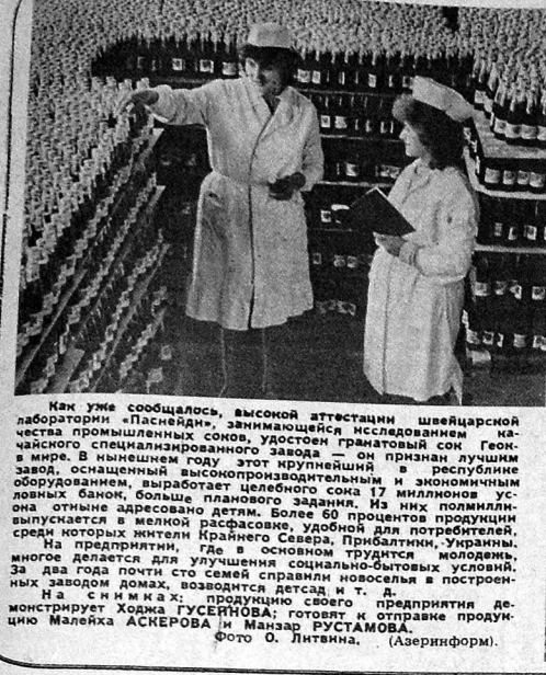
Как уже сообщалось, высокой аттестации швейцарской лабораторией «Паскеид», занимающейся исследованием качества промышленных соков, удостоен гранатовый сок Геокчайского специализированного завода — он признан лучшим в мире. В нынешнем году этот крупнейший в республике завод, оснащенный высокопроизводительным и экономичным оборудованием, выработает целебного сока 17 миллионов условных банок, больше планового задания. Из них по миллиону выпускается в мелкой расфасовке, удобной для потребителей, среди которых жители Крайнего Севера, Прибалтики, Украины. На предприятии, где в основном трудятся молодежь, многие делают для улучшения социально-бытовых условий. За два года почти сто семей новоселья в построенных заводом домах, возводятся дача и т. д. На предприятии также производится своего предприятия дежурит Ходжа Гусейнова; готовит и отправляет продукцию Малейха АСКЕРОВА и Манзар ЮСМАИЛОВА.