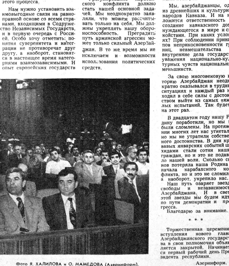
Во время принятия присяги.

ПРЕЗИДЕНТУ АЗЕРБАЙДЖАНСКОЙ РЕСПУБЛИКИ ГОСПОДИНУ АБУЛЬФАЗУ ЭЛЬЧИБЕЮ Уважаемый господин Президент! Примите мои искренние поздравления в связи с всенародным избранием Вас на высший государственный пост Республики Азербайджан. Выражаем надежду, что это важное политическое событие даст новые позитивные импульсы развитию отношений между нашими государствами на основе принципов, принятых мировым сообществом в качестве норм международного права. Россия выступает за скорейшую нормализацию конфликтов на местеческой основе, и Вы, уважаемый господин Президент, можете рассчитывать на нашу поддержку в поиске мирных путей восстановления стабильности и справедливого решения существующих проблем и недопущения новых. Желам Вам успехов в Вашей ответственной деятельности на посту Президента, мудрости и дальновидности при принятии государственных решений, а народам Азербайджана — мира и процветания. Президент Российской Федерации В. ЕЛЬЦИН.