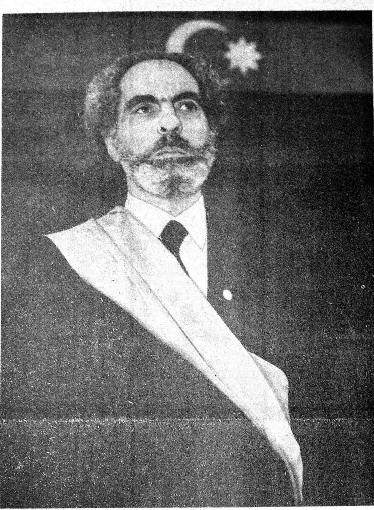
Во время принятия присяги.

Торжественная церемония вступления нового главы Азербайджанского государства в свои полномочия объявляется закрытой. Начинается первый рабочий день Президента республики.