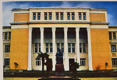
Здание Бакинской музыкальной академии.

БАКИНСКАЯ МУЗЫКАЛЬНАЯ АКАДЕМИЯ имени Узеира Гаджибейли (Üzeyir Hacıbəyli adına Bakı musiqi akademiyası) – ста-