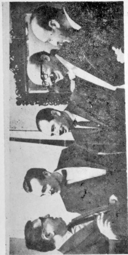
После премьеры Концерта для симфонического оркестра С. Гаджибекова. Баку, май, 1964. Слева направо: Ф. Амиров, Г. Рождественский, Т. Кулиев, Р. Щедрин, С. Гаджибеков.