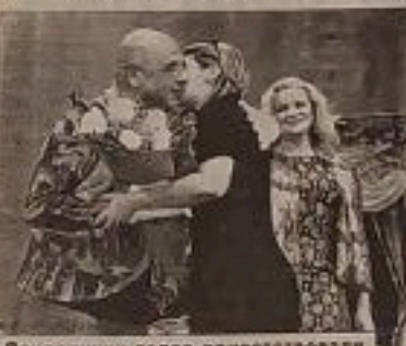
Поклонники тепло приветствовали московских артистов

В пасмурный день, сыпавший дождик много тепла и радости живыми словами. Искрометная комедия положений в комичной ситуации, но весьма оригинальными "персонажами" события.