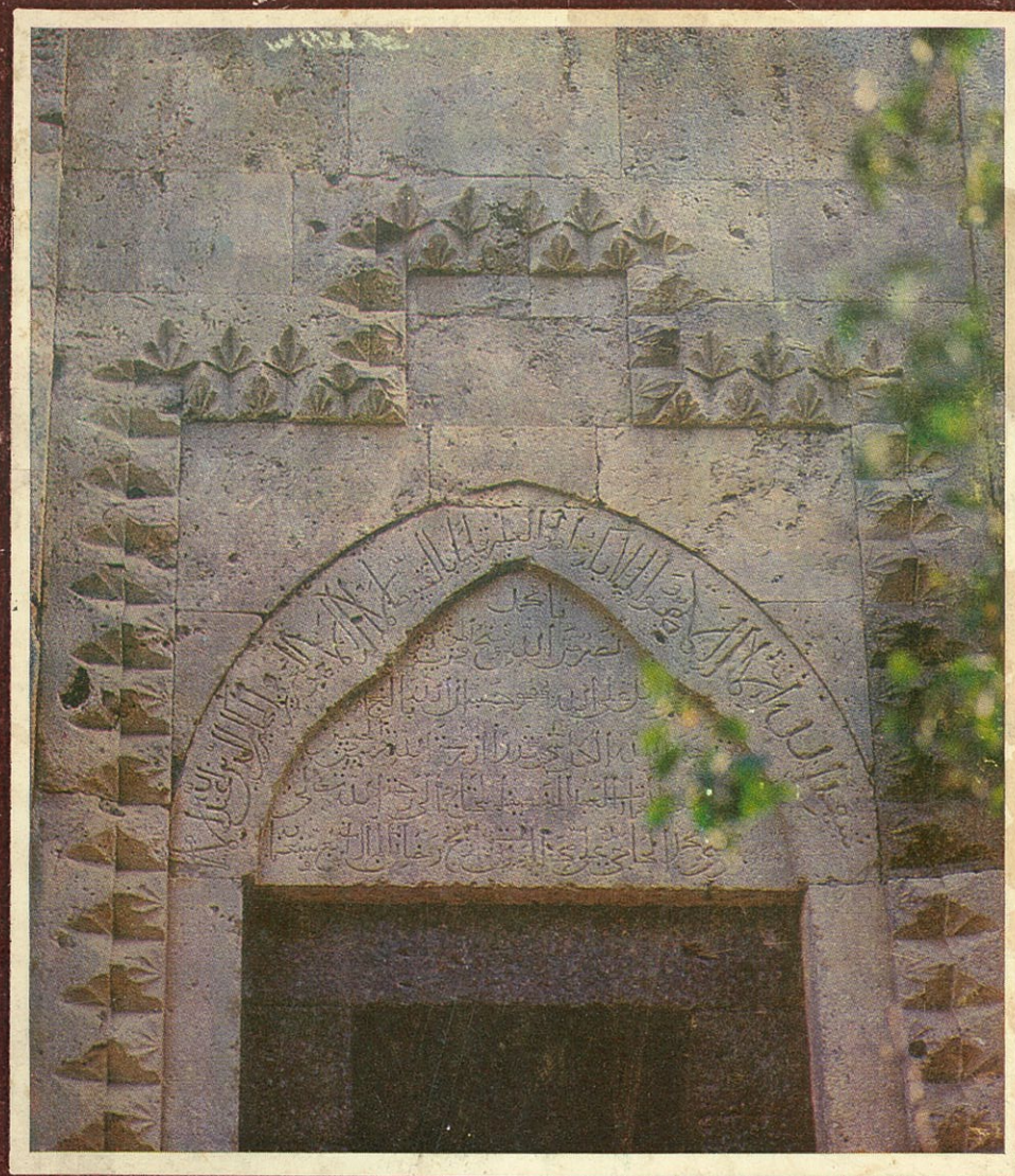
ЭПИГРАФИЧЕСКИЕ ПАМЯТНИКИ АЗЕРБАЙДЖАНА ЭПОХИ НИЗАМИ