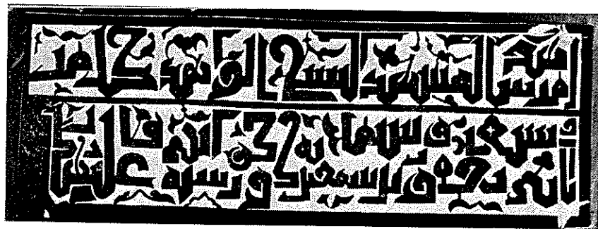
Рис. 26. Куфическая надпись над входом мавзолея Шейха Баби Якуба в с. Бабы Физулинского района.

Размещение крупных религиозных центров на торговых путях свидетельствует об использовании ислама в качестве идеологической силы для решения экономических и политических проблем эпохи феодализма. Ханега Шейха Баби Якуба, которая являлась