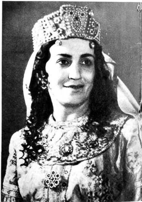
С. Вургун «Фархад ва Ширин» Марям