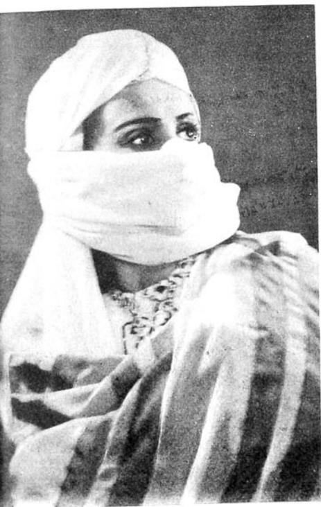
И. Чавид «Шейх Сэн'ан» Захра