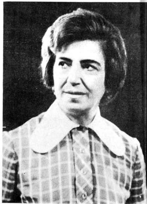
Н. Хазри «Сәи јанмасаи» Дурданә