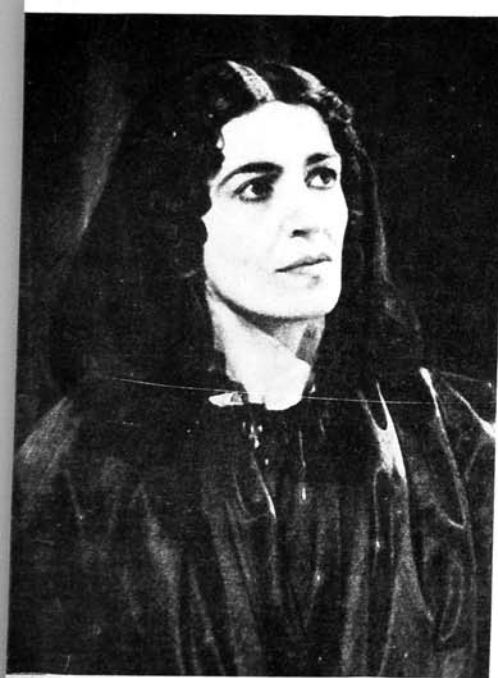
В. Шекспир «Гыш нағылы» Паолина