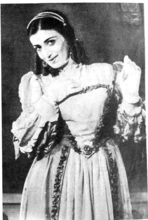
К. Галдони «Мазали әһвалат» Констансија