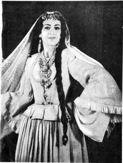
Ч. Чаббарлы «Солгун чичаклар» Пари