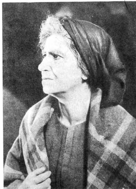
1971 516 Б. Шоу «Шейтанын шакирди» миссис Дагчен