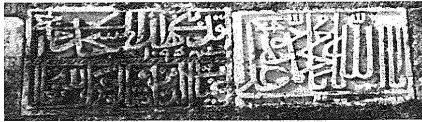
Рис. 14. Надпись в мечети, с. Каргабазар, Физулинский р-н

Аллаха. 1095 г. х. (=1683/84 г.)» 1 . Правее и выше указанной надписи ломаным почерком выщерблены по-арабски слова: «О, открыватель двери!» 2 .