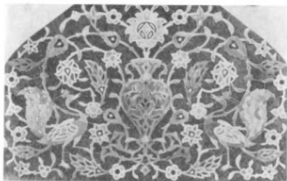
42. Ардебиль. Культурный комплекс шейха Сефи. Деталь орнамента

здание мечети состоит из квадратного молебельного зала, перекрытого куполом, и примыкающих к углам зала небольших помещений. На южной стороне размещен михраб, подчеркнутый глубокой нишей. Многочисленные проемы, соединяющие между собой зал, порталные ниши и угловые помещения, придают плану своеобразие — сочетание пространственности общей композиции с довольно частыми проемами сообщают интерьеру легкость. Это стремление избежать грузности характерно и для фасадов кировабадской джума-мечети, кирпичная кладка которой имеет легкие накладные обрамления.