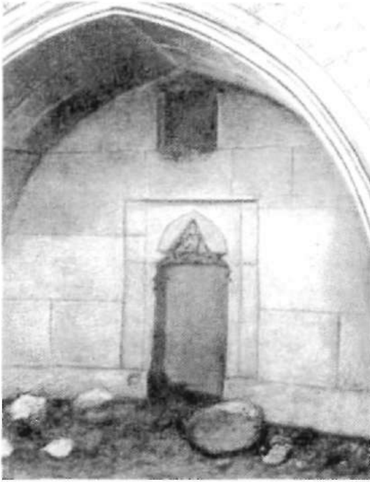
Sərdaba. Şarifan kəndi. XIII-XIV əsrlər. Tomb. Sharifan Village. 13th–14th century