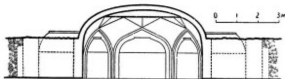
22. Барда. Мавзолей Ахсадан-баба. Интерьер, план и разрез склепа