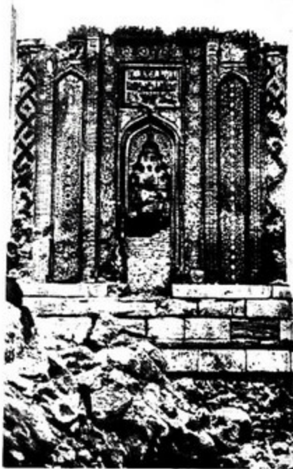
110. Мараса. Гуибад-е Гаффарийе, XIV в.

Гуибад-е Гаффарийе в Марасе принадлежит к сравнительно малочисленной группе «кубических» мавзолеев. Обе группы памятников свидетельствуют о древних связях Закавказья и Закаспия 116 . Основная масса «башенных» мавзолеев находится на территории Азербайджана и Хорасана, и их особенности встречаются в архитектуре немногих памятников Средней Азии. Иная картина наблюдается при рассмотрении «кубических» мавзолеев. В строительстве Средней Азии они широко распространены, а на территории Азербайджана представлены немногими памятниками, в том числе и Гуибад-е Гаффарийе 117 . Композиционно он повторяет Красный мавзолей, построенный двумя веками раньше.