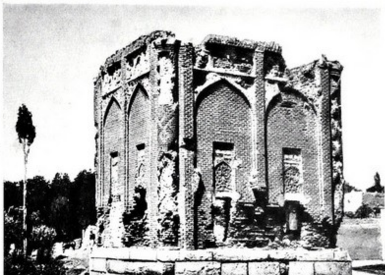
112. Гуибад-е Гаффарийе

Главный фасад очень наряден. В центре композиции находится превосходно прорисованный портал, сходный с порталами мавзолея в Карабагларе. Его стрельчатая арка обрамлена лентами орнамента, в котором преобладают геометрические мотивы. Сталактитовое заполнение подарочного пространства напоминает сходные порталы карабагларского мавзолея. Над замком арки расположена трехстрочная надпись несомненно сообщая о повелении соорудить мавзолей в правление Абу Саида Бахадур-хана, т. е. между 1319—1335 гг. 118 Эта датировка полностью отвечает его архитектурным особенностям. Любопытны членения фасада. Между угловыми полуколоннами и порталом тянутся узенькие стрельчатые ниши, удлиненность которых облегчает тяжеловесность общих пропорций. Поверхность угловых полуколонн обработана двухцветным узором из поливного и обычного кирпича, а плоскости ниш покрыты геометрическими плетениями. Членения заднего фасада повторяют схему Красного мавзолея — две стрельчатые ниши, слегка заглубленные в стену. Разница трактовки заключается лишь в более богатом убранстве мавзолея Гаффарийе. Узорчатая кирпичная кладка заменена небольшими прямоуголь-