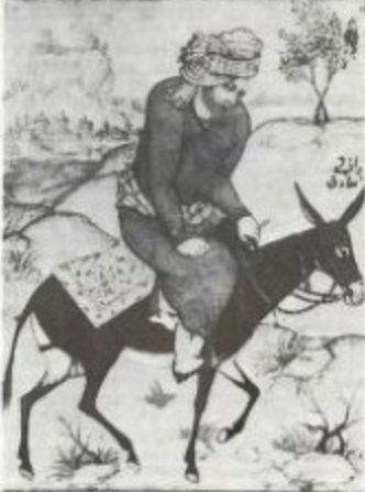
Садиғ бәј Әфшар. «Суварин дәрвини», 16 әсрин соку. Пари Милли Китабханасы.

Әсәрәт Гауун әс-сонар (Воединовер и комментарии А. Ю. Казиева), В., 1963.