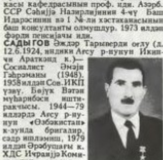
А. Садыгов. «Мәчәзә ул-хавас», 1900-чы иллор. Мәчәзә ул-хавас китабында.

САДЫГОВ Әлвәст Ширәли оғлу (22. 12.1906, Нуха, илдикә Шаки — 17.10.