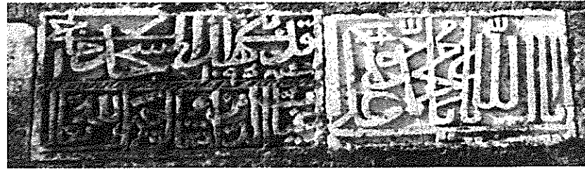
Рис. 14. Надпись в мечети, с. Каргабазар, Физулинский р-н

Аллаха. 1095 г. х. (=1683/84 г.)» 1 . Правее и выше указанной надписи ломаным почерком выщерблены по-арабски слова: «О, открыватель двери!» 2 .