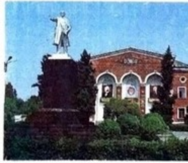
Хачмаз шәһәриндән көрүнүш.

ХАЧМАЗ — Азәрб. ССР-дә шәһәр (1936—38 илләрдә штг). Хачмаз р-нуни мәркәзи. Бақы—Ростов-Дон д.ј.-и-да ст. Бақындан 163 км аралыдыр. Дәвәчи—Дәрбәнд (Дағ.МССР) автомобиль јолу кәһриәндә, Гудјал чайы саһилиндә, Самур-Дәвәчи овалығындадыр. Х.-да консерв комбинаты, чорәк, пивә-спиртсиз ичкиләр э-дләри, халча мүс-сәси, електрик шәбәкәси, мәшһәт хид-мәти комбинаты, картон габлар ф-ки, әрзағ маңсуллары комбинаты, техникни пешв мәктаби, үмумтәһсил мәктәпләри, Азәрбајҗан Битки Мүһәфизә ст.-һыи