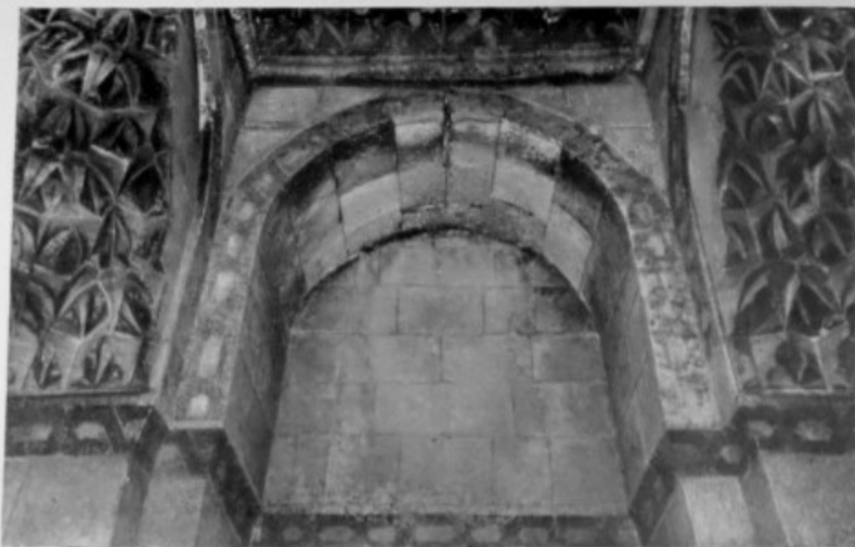
147. Мавзолей. 1314 г. Деталь интерьера