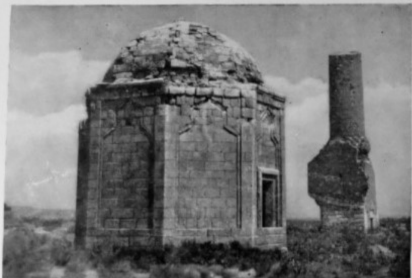
149. Сел. Бабь (Физулинский р-н). Мавзолей шейха Бабали 1272 г. Вид с запада