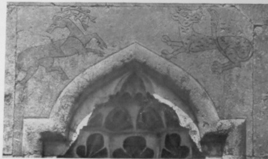
148. Мавзолей. 1314 г. Деталь декоративной ниши

меров дополнительного освещения верхней камеры, куда обычно свет проникает только через входные проемы.