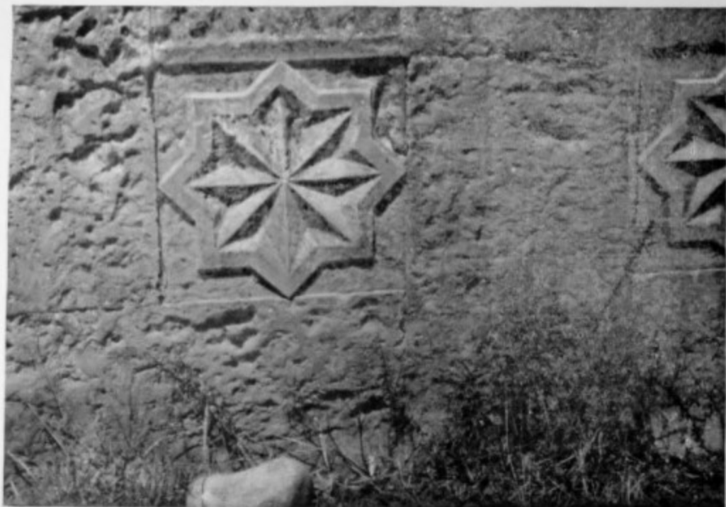
150. Мавзолей шейха Бабали. Розетки нижнего пояса