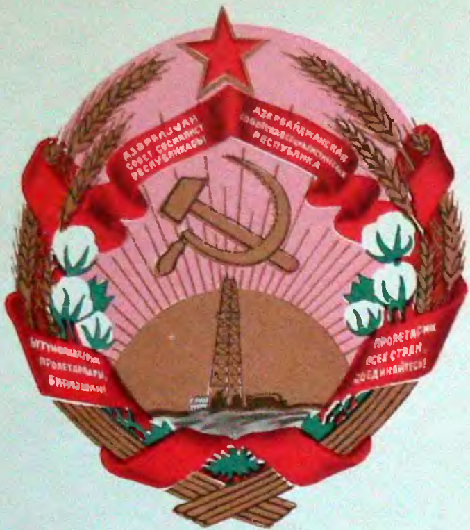
Государственный герб Азербайджанской Советской Социалистической Республики