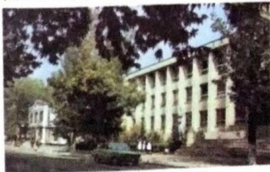
Фүзули шәһәриндән көрүнүш.

Тәбиәт. јына тәрәф г.-дә алчаг силәсинин Неокен чөв Иглими ш. лајим-исти һиссәдә јай дир. Орта т да 24—25°С 600 мм. Ча чај, Гөзлүч дан ахан А