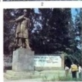
Фузули рајону. 1. Фузули шибари, Н. Ньрванови мочеси, 2. Толам элвна совхозу уьтм батларини, 3. Фузули јаз-индилер шибониде. Маьмонид Фузулине баьлини.

мий (1986, 1 јанвар), Р-нда 1 шибир, 1 шт. 71 каьд ва гьс. вар. Меркази Фузули ш-дир.