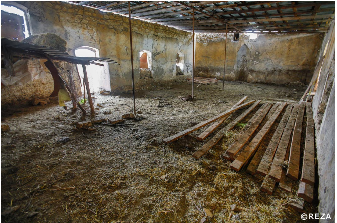
Мечеть в Алханлы. Физулинский район.

Армяне разрушили и разграбили комплекс Имарат XVIII в. в Агдаме, где захоронены карабахские ханы и их потомки, и держали там свиней. Реза Дегати побывал на этом месте и написал в своем инстаграм канале следующее: