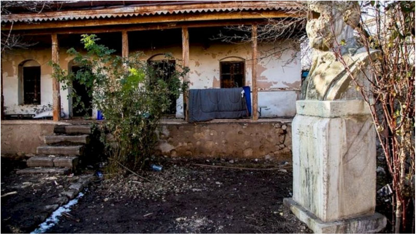
Дом-музей Бюль-бюля в Шуше

Также после оккупации Шуши в 1992 г. бюсты деятелей азербайджанской культуры Хуршид-Бану Натаван, Узеира Гаджибекова и Муртузы Мамедова (Бюль-Бюля) в Шуше были демонтированы армянами (и были изрешечены ими пулями) и вывезены в Грузию для продажи на металлолом. Однако, с помощью правительств Азербайджана и Грузии они были выкуплены и перевезены в Баку, где хранились в Национальном музее искусств Азербайджана. В 2021 г. памятники этих деятелей были возвращены в Шушу.