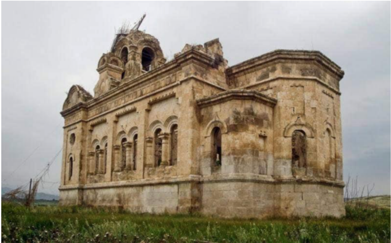
Русская Православная церковь. Ходжавендский район

Азербайджан неоднократно привлекал внимание международного сообщества к разрушению его культурного наследия и обращался к Организации Объединенных Наций по вопросам образования, науки и культуры (ЮНЕСКО) и другим международным организациям с просьбами направить миссии на оккупированные территории и принять срочные меры для обеспечения защиты находящихся там культурных ценностей. Спустя несколько дней после оккупации Шуши министр Культуры Азербайджана Полад Бюльбюль оглы отправил обращение на имя генерального директора ЮНЕСКО Фредерика Майора, генерального секретаря Международного Совета музеев (ИКОМ) Элизабет де Порт, министров культуры и искусства многих стран мира. В обращении указывалось, что армянские захватчики с помощью танков и ракетных орудий уничтожают памятники архитектуры и искусства в Шуше и совершают акты мародерства.