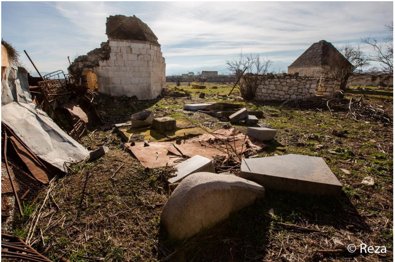
Комплекс "Имарет". Агдам.