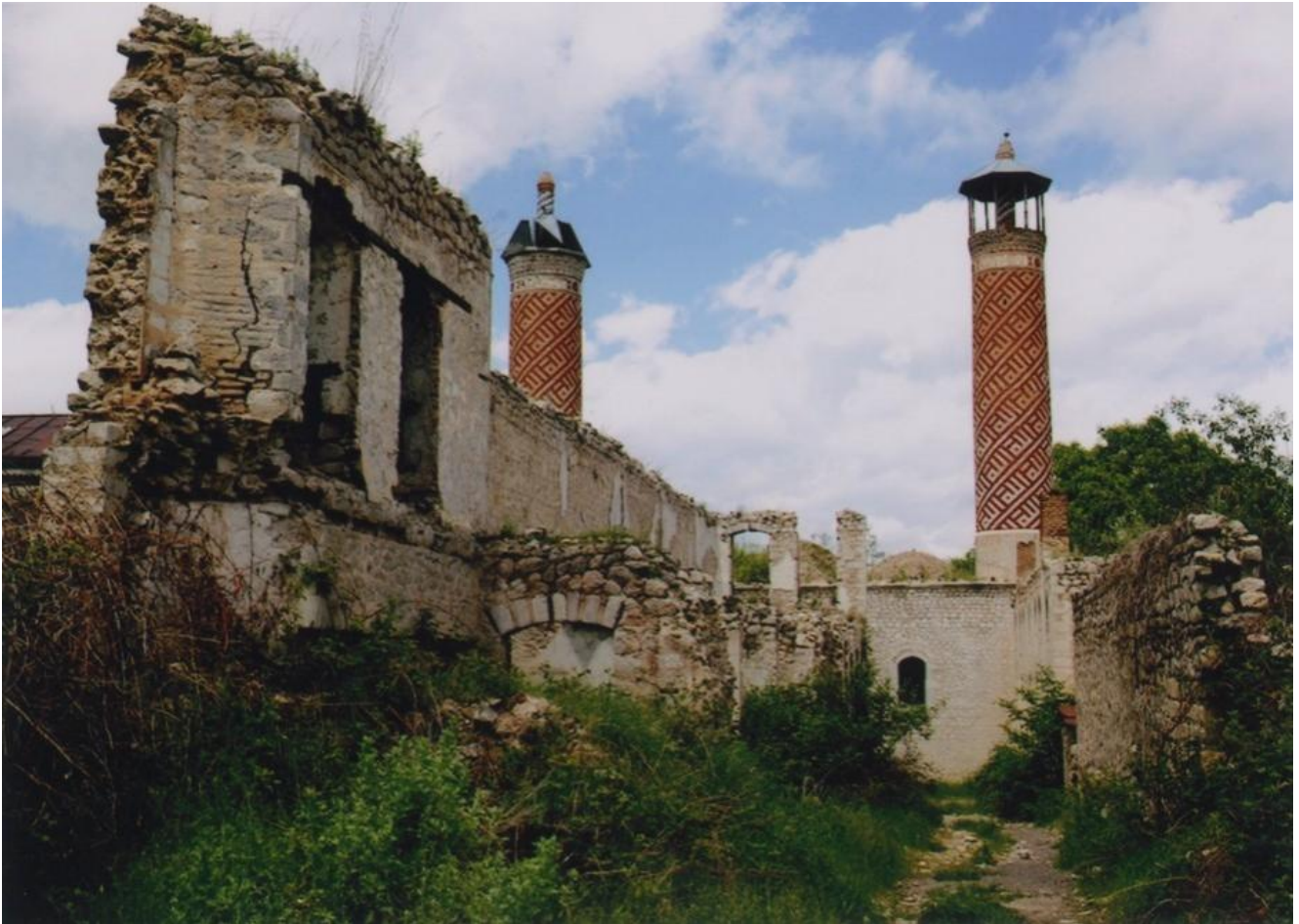
Нижняя мечеть Гевхар аги

В 2020 г. в рамках сотрудничества Международного фонда турецкой культуры и наследия, Института права и прав человека НАНА и Национальной комиссии Азербайджана в ЮНЕСКО была проведена работа по изучению ущерба, нанесенного историческим и культурным памятникам на оккупированных армянами территориях Азербайджана. Согласно полученным данным, из 67 мечетей нагорной части Карабаха и 7 прилегающих районов (13 в Шуше, 5 в Агдаме, 16 в Физули, 12 в Зангелане, 5 в Джебраиле, 8 в Кубатлы, 8 в Лачине) 63 оказались полностью разрушенными, а 4 частично разрушенными. В работе указывается, что в Шуше ущерб нанесен 217 историческим и культурным памятникам, в Агдаме – 140, Джебраиле и Ходжавенде – по 93 в каждом, Кельбаджаре – 70, Лачинском районе – 73, Губадлы – 67, Физули – 71, Зангелане – 56 и в Ходжалы – 28 памятникам истории и культуры.