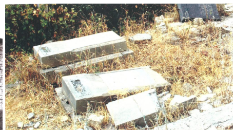
Şuşada dağıdılmış Azərbaycan qəbrsənliyi