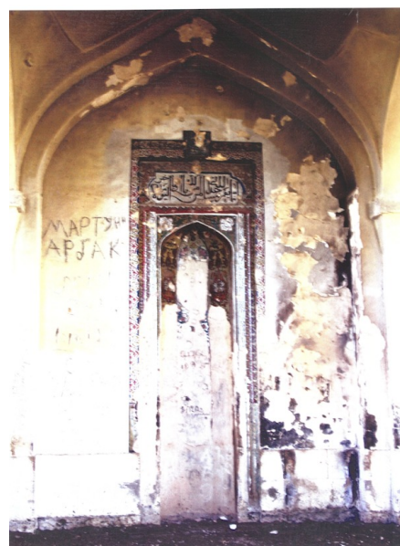
Dağıdılmış Ağdamın müqəddəs məscidi

eksponatı talan olunmuş, 44 məbəd və 18 məscid təhqir edilmişdir. Dağıdılan və yandırılan 927 kitabxanada 4,6 (4 milyon 6 yüz min) milyon kitab və misilsiz əlyazma nümunələri məhv edilmişdir». İndi isə, işğal olunmuş ərazilərin azad edilməsindən sonra məlum olur ki, daha da böyük sayda dini və tarixi-mədəni obyekt məhv edilib (təkcə məscidlərin sayı – 67). Avropa ölkələrinin liderləri bu barədə heç bir narahatlıq göstərməyiblər. Lakin indi, Qarabağ Azərbaycana qaytarıldığından sonra, noyabrın 19-da Emmanuel Makron “Dağlıq Qarabağın dini və mədəni irsinin qorunması üçün qətiyyətli qərarlar qəbul etmək” istəyi barədə bəyan edib.