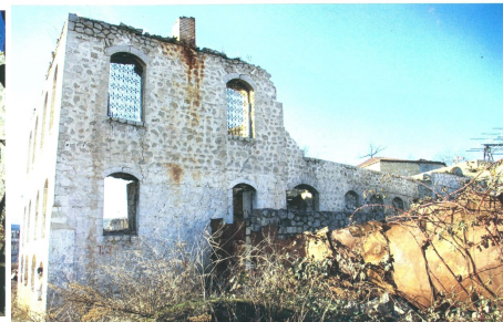
Şuşada dağıdılmış məscid