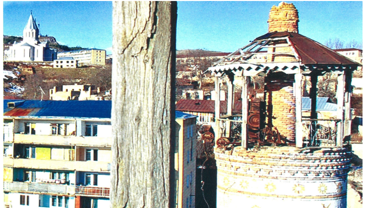
Şuşadakı dağıdılmış Saatlı məscidi

Lakin, 30 ilə yaxın müddət ərzində onlarla məscidin, müsəlman məqbərələrinin və qəbristanlıqların barbarcasına məhv edilməsini Fransa və digər Avropa ölkələrinin hakimiyyəti diqqətsiz qoymağa üstünlük verirdilər.