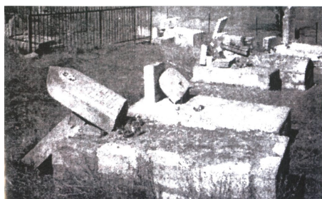
Разрушенное азербайджанское кладбище в Шуше