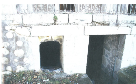
Разрушенная мечеть в Шуше