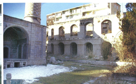
Разрушенная мечеть в Шуше