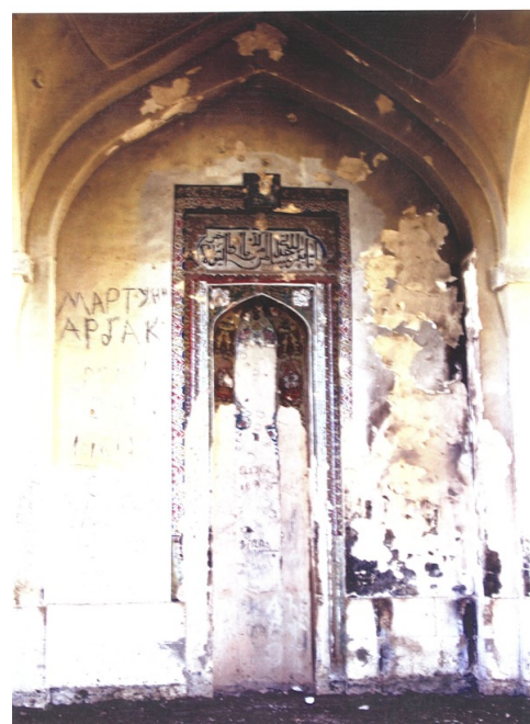
Священная мечеть разрушенного Агдама

были варварски разграблены и уничтожены. Осквернены 44 мавзолея, 18 мечетей. В 927 библиотеках уничтожены 4.6 млн. книг, бесценных рукописей». Теперь же, после освобождения оккупированных территорий, выясняется, что уничтожено было гораздо больше религиозных и культурно-исторических объектов (одних только мечетей – 67). Никакого беспокойства по этому поводу лидеры европейских стран не проявляли. Зато теперь, после возвращения Карабаха Азербайджану, 19 ноября президент Эммануэль Макрон объявил о желании Франции «принять решительные меры для защиты религиозного и культурного наследия Нагорного Карабаха».