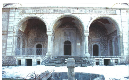
Разрушенная мечеть в Шуше