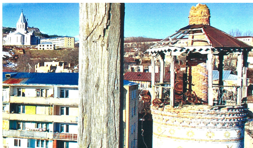
Разрушенная мечеть Саатлы в Шуше

Президент Макрон объявил о желании Франции «принять решительные меры для защиты религиозного и культурного наследия Нагорного Карабаха» после освобождения Азербайджаном этих территорий. Но то, что в течение почти 30 лет там варварски уничтожались десятки мечетей, мусульманских мавзолеев и кладбищ, руководство Франции и других европейских государств предпочитали не замечать.