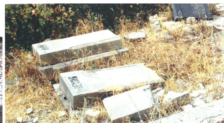
Разрушенное азербайджанское кладбище в Шуше