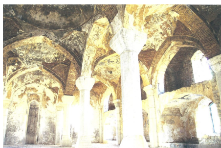
Разрушенная мечеть в Шуше