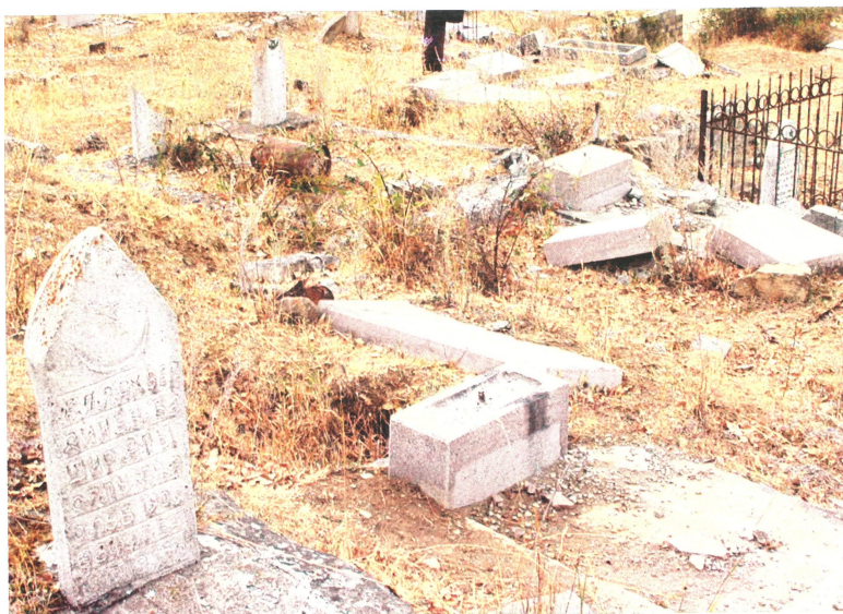
Азербайджанские кладбища, разрушенные армянами в Шуше

Они подчеркнули, что «Армения ведет против нашей страны лживую пропаганду религиозной направленности, утверждая, что Азербайджан якобы предпринимает шаги, направленные на разрушение религиозно-культурных памятников на наших освобожденных территориях, и пытается тем самым свалить на нашу страну ответственность за свои провокационные действия».