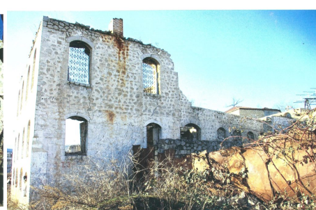
Разрушенная мечеть в Шуше