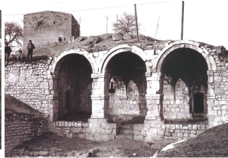
Caravansérai du 17ème siècle dans le village de Gargabazar (Fizuli)