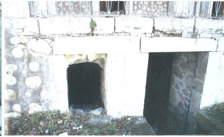
Mosquée détruite à Choucha