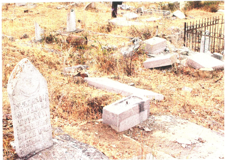
Les cimetières azerbaïdjanais des territoires occupés détruits par les Arméniens

Le 23 novembre, le président Ilham Aliyev a visité la mosquée détruite d'Aghdam, libéré le 20 novembre. Aliyev a déclaré là-bas, que plusieurs années auparavant les représentants du Groupe de Minsk qui jouait le rôle de médiateur, s'y étaient rendus. "Ils ont effectué des missions ici à deux reprises et m'ont informé qu'ils avaient visité la mosquée d'Agdam. Pourquoi n'ont-ils pas soulevé la question? Pourquoi cela n'a-t-il pas inquiété les dirigeants occidentaux? Il s'avère que les mosquées musulmanes peuvent être profanées et détruites, que les vaches et les porcs peuvent y paître. Si tel est le cas, qu'ils gèrent les problèmes dans leurs pays, il ne faut pas se mêler de nos affaires", a noté le dirigeant d'Azerbaïdjan.