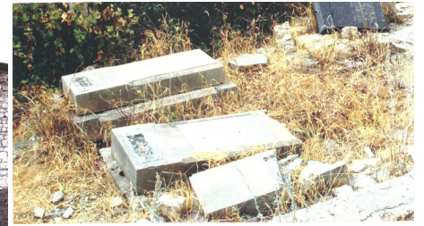
Cimetière azerbaïdjanais détruit à Choucha