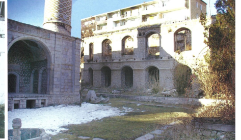
Mosquée détruite à Choucha