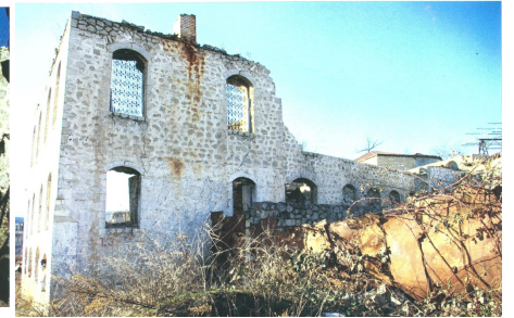
Mosquée détruite à Choucha