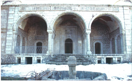
Mosquée détruite à Choucha