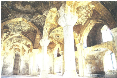
Mosquée détruite à Choucha