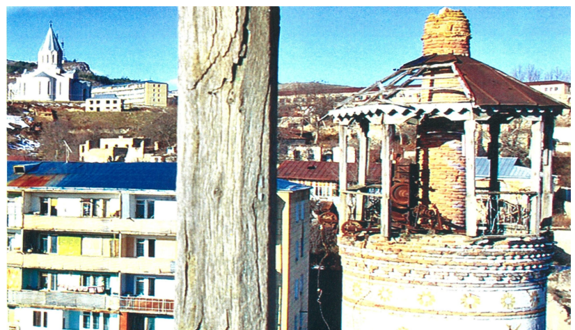
Mosquée Saatly, Choucha, 2006

Le président Macron a annoncé “sa volonté que des mesures fortes soient prises pour protéger le patrimoine religieux et culturel du Haut-Karabakh” après la libération de ces territoires par l’Azerbaïdjan. Mais le fait que pendant près de 30 ans des dizaines de mosquées, de mausolées et de cimetières musulmans y ont été sauvagement détruits, les dirigeants de la France et d’autres États européens ont choisi d’ignorer.